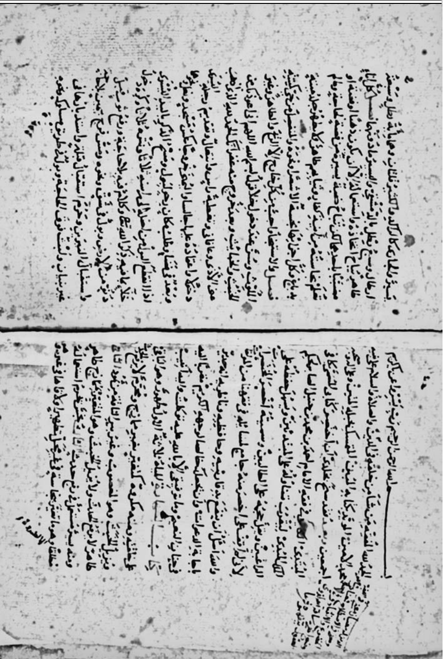
صورة الورقة الأولى من النسخة (د)